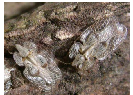
プラタナス(アメリカズカケノキ)の樹幹の北面でプラタナスゲンバユムシが集団越冬