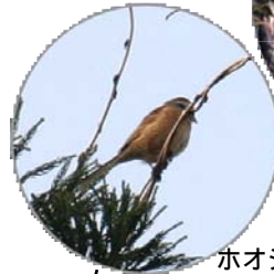
ホオジロがさえずってました