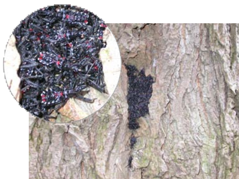
ニセアカシアの樹幹の北面(南面より気温が安定)でヨコズナサシガメが集団越冬