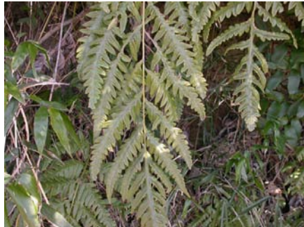
コモチシダは条件に応じて無性芽あるいは孢子で増殖する