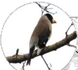
珍しくコイカルが姿を現しました