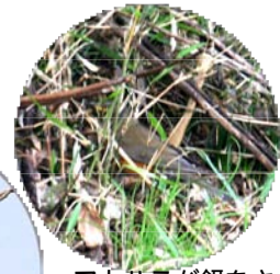
アカハラが餌をさがしてました (どこにいる?)