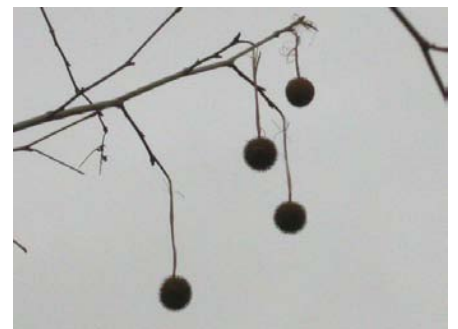
果実が柄に一個ずつつくのがアメリカズカケノキ