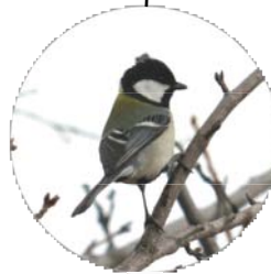
シジュウカラが活発に動き回っていました