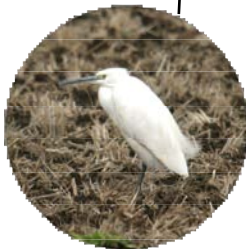
田んぼの中でコサギが休んでいました