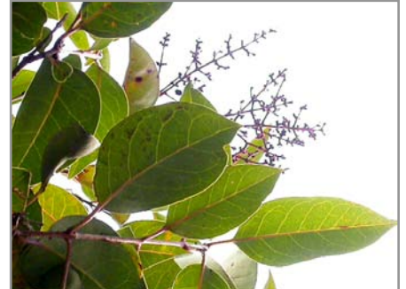
葉脈が透けて見えるのが、トウネズミモチ (cf.ネズミモチ)