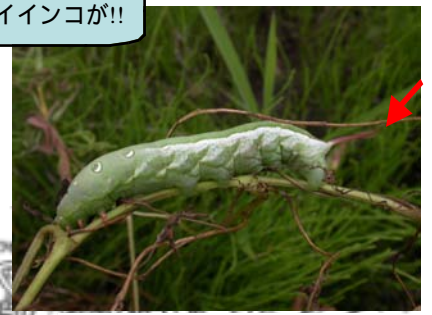
コスズメの幼虫（おしりのアンテナがスズメガの仲間の特徴）