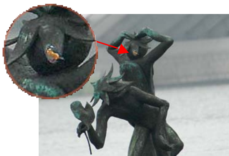
河童の噴水でカワセミが一休み