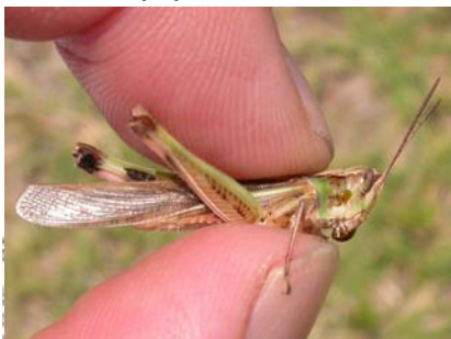
マダラバツタ（小型のスリムなバツタです）