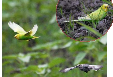
ムクドリに混じったカゴ抜けのセキセイインコ（ハクセキレイに追われていました） * 中野久夫さん撮影