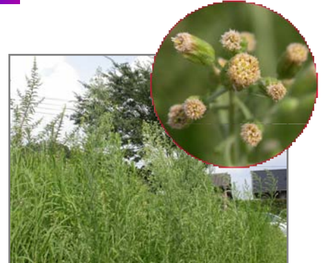
駐車場下の土手に繁茂するオオアレチノギクとその花（円内）