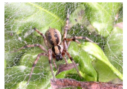
棚網の上で獲物を待つクサグモ