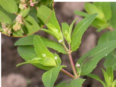
オオニシキソウ（トウダイグサ科）の花（茎を折ると白い液が出る） * 円内はコニシキソウ