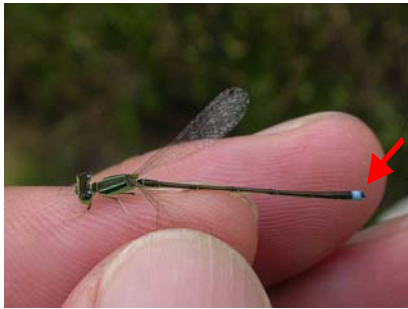
草原の中を飛んでいたアジイトンボ（腹部第9節が青色、第8節が青いのはアオモンイトンボ）