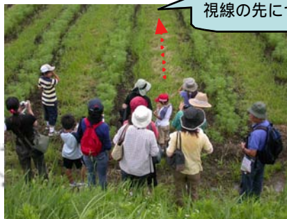
カゴ抜けのセキセイインコをみんなで観察