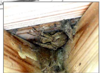
あずまやの屋根裏にすむオニグモ（夜に網を張り活動する）