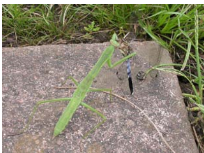
シオカラトンボの雄を食べるオオカマキリの幼虫