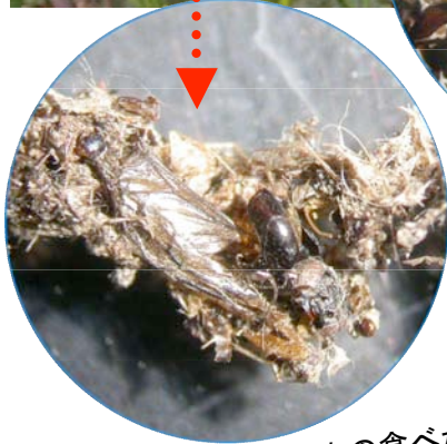
↑餌食となった昆虫の食べかす