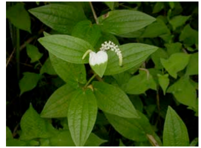
④ハンゲショウ(半夏生)の群落がありました