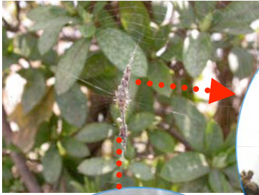
①ゴミグモのごみの中身は？