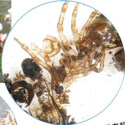
↑ゴミグモ自身の脱皮殻