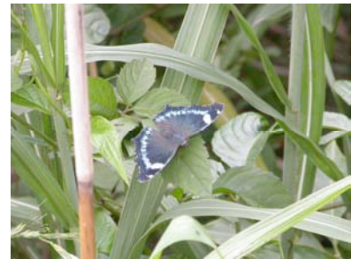
*写真は同月湖北集水路前のヨシ原