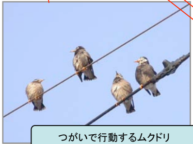
つがいで行動するムクドリ