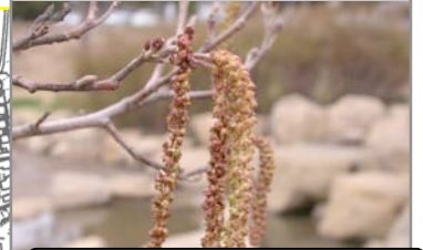
花粉を飛ばし終えたハンノキの雄花