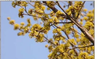
庭先に咲いていたのはサンシュユ(春黄金花)の花でした