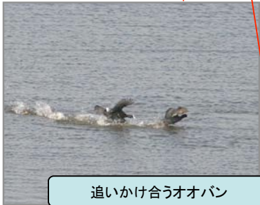
追いか合おうオオバン