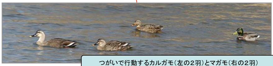
つがいで行動するカルガモ(左の2羽)とマガモ(右の2羽)