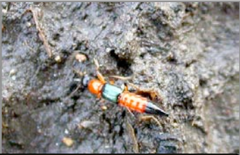
有毒注意！アオバアリガタハネカクシ