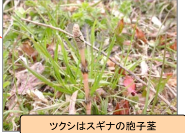
ツクシはスギナの胞子茎