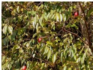
朱色が目立つカラスウリの果実