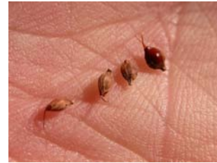
動物の体に付き運ばれるミズヒキの種子