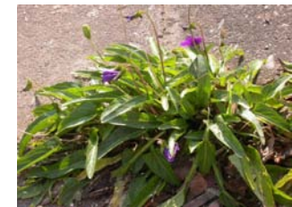
路傍に咲いたスマイレ