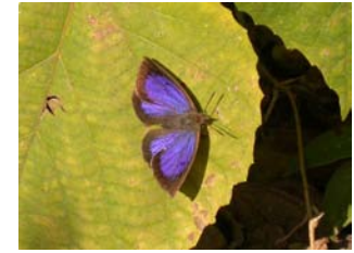
成虫越冬のムラサキシジミ