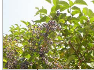
トウネズミモチの種子