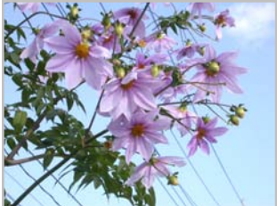
メキシコ原産キダチダリア