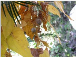
ヤマノイモの黄葉とムカゴ