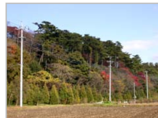
紅葉で色づいた斜面林