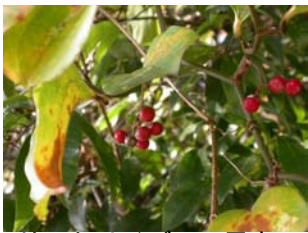
サルトリイバラの果実