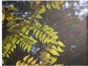
サンショウの黄葉