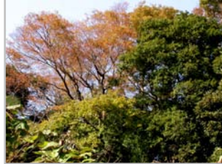
紅葉した斜面林のクスノキ