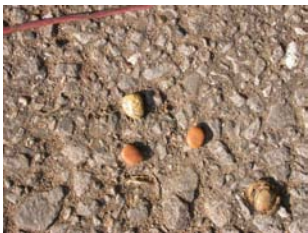
鳥の糞から洗い出されたハゼの種子