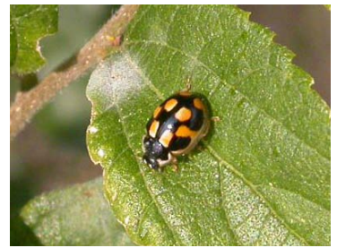
ヒメカメノコテントウ