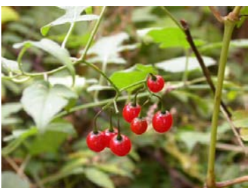
ヒヨドリジョウゴ