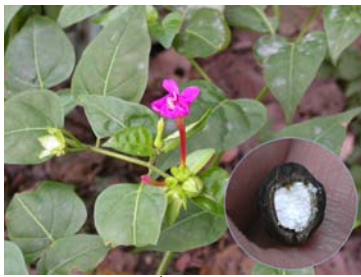
オシロイバナとおしろい!?