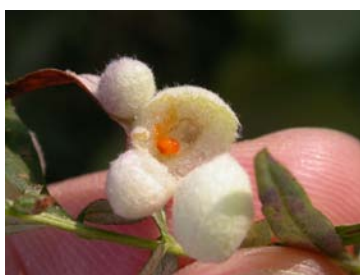
ヨモギハシロケタマフシ