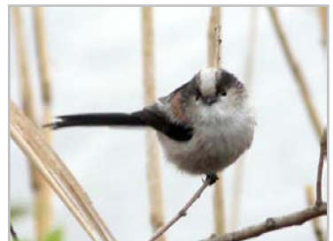
斜面から田んぼにでてきたエナガ