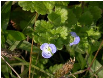
オオイヌノフグリの花