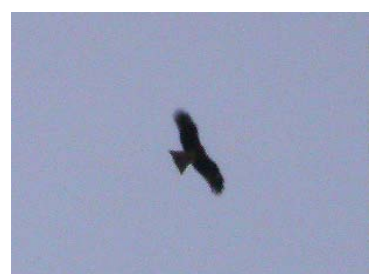
この地域ではめずらしいトビ