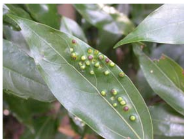
シロダモハコブフシ