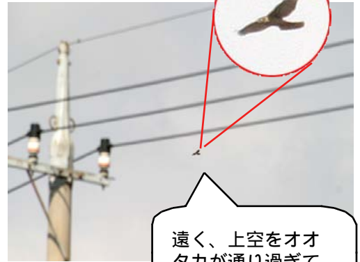
遠く、上空をオオタカが通り過ぎてゆきました。