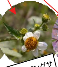
シロノセンダングサ