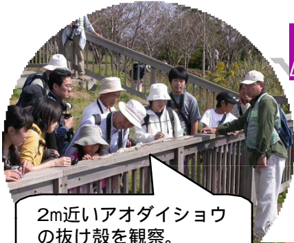
2m近いアオダイショウの抜け殻を観察。

ケツアールを発見！ *現地でケツアールと呼ばれるこの鳥は、カザリキヌバナドリと言われる中米グアテマラの国鳥にもなっている美しい鳥です。