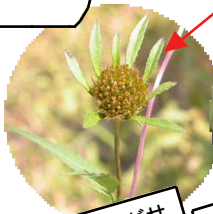
アメリカセンダングサ

渡来したばかりのカモはまだきれいな繁殖羽になってません。徐々に体の羽毛が換羽してゆきます。写真はオナガガモの雄。