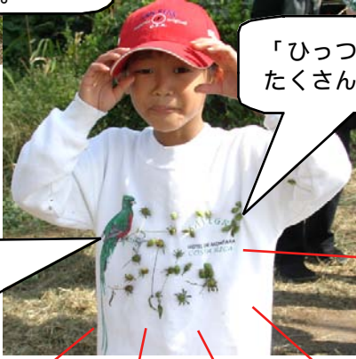
「ひっつきむし」がたくさん。

ケツアールを発見！ *現地でケツアールと呼ばれるこの鳥は、カザリキヌバナドリと言われる中米グアテマラの国鳥にもなっている美しい鳥です。