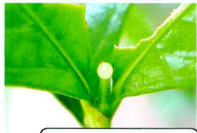
クチナシの葉に アオスカシバの卵が・・・