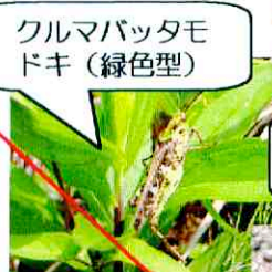
クルマバッターモ ドキ (緑色型)