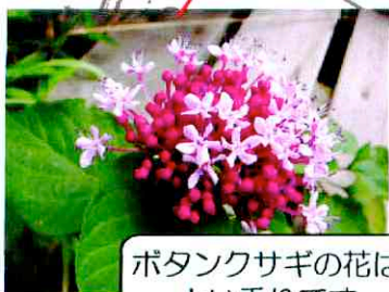
ポタンクサギの花は よい香りです