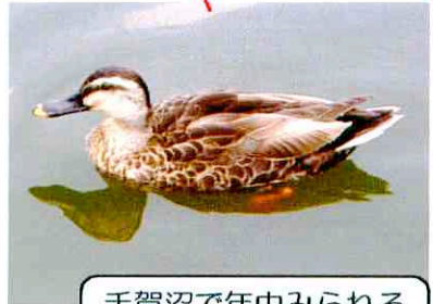
手賀沼で年中みられる 夏留鴨 (カルガモ)