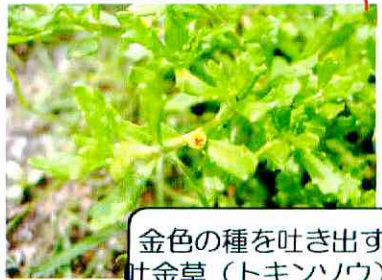
金色の種を吐き出す 吐金草 (トキンソウ)