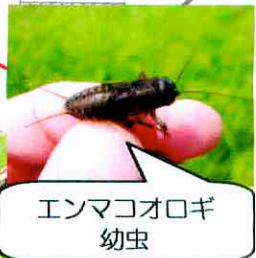
エンマコオロギ 幼虫