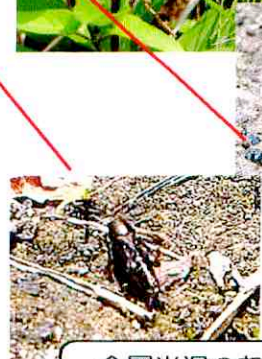
金属光沢のある ノミバッター